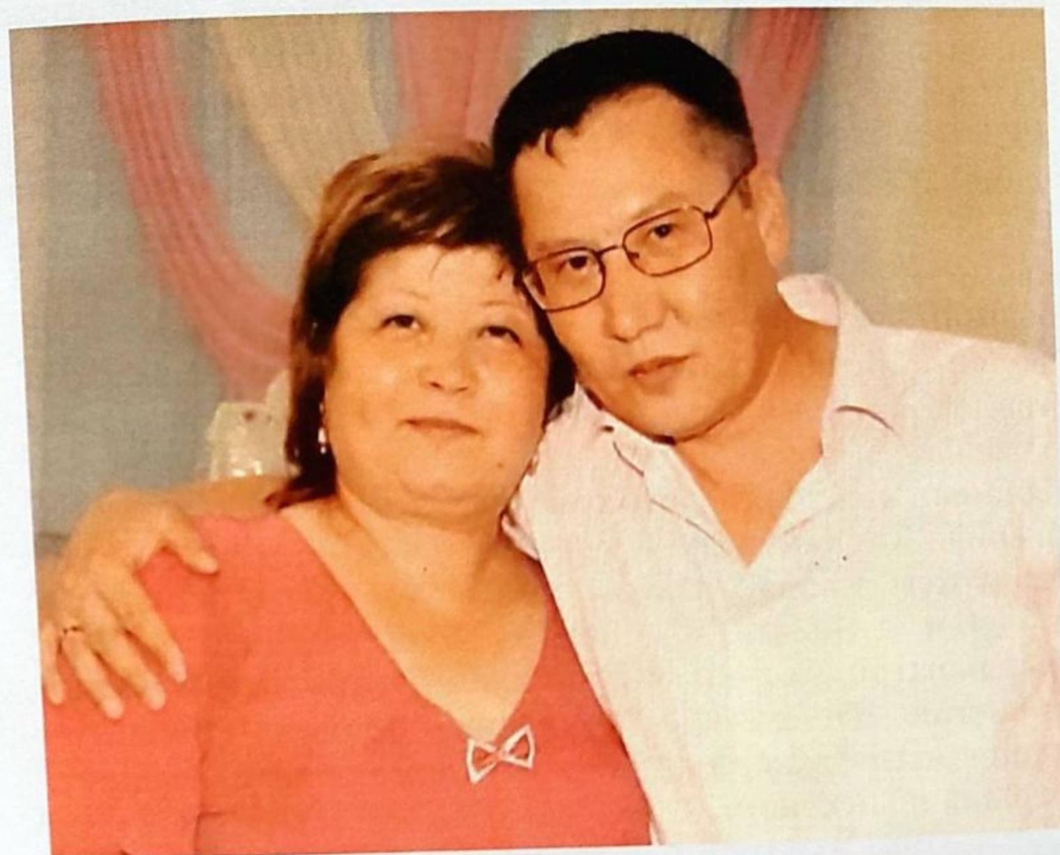
Куләш өмірсерігі Болатпен тату-тәтті, демалыс кезінде

куат күші тамыр арқылы беріліп жер бетін жасыл өскін мен желекке бөлейтінін түйсінеміз, түзу өсетін өскін мен жасыл желегімізді мәпелеп күтіп баптаймыз, бойымыздағы бар асыл қасиеттерімізді, мейірім шапағатымызды төгіп үміт күтеміз, сенім артамыз. Үкілеген осы армандар мен мақсаттарға толы әрекетіміздің қаймағы бұзылмаған, бүгінгі таңдағы ақ ордасы бөбекжай балабақшалары десек қателеспейміз.